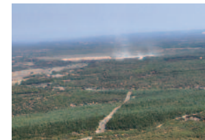
nuages de poussières