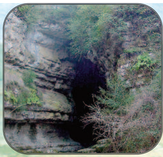
Le porche de la Goule de Sauvas, à 50 m de la carrière, déjà fissuré.